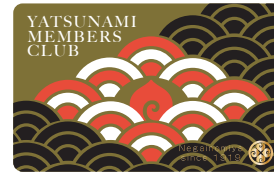
メンバーズカード(IDナンバー入り)

お宮の月例祭、大祭などにもいつでもお越 しいただけます。受付でメンバーズカードを ご提示下さい。