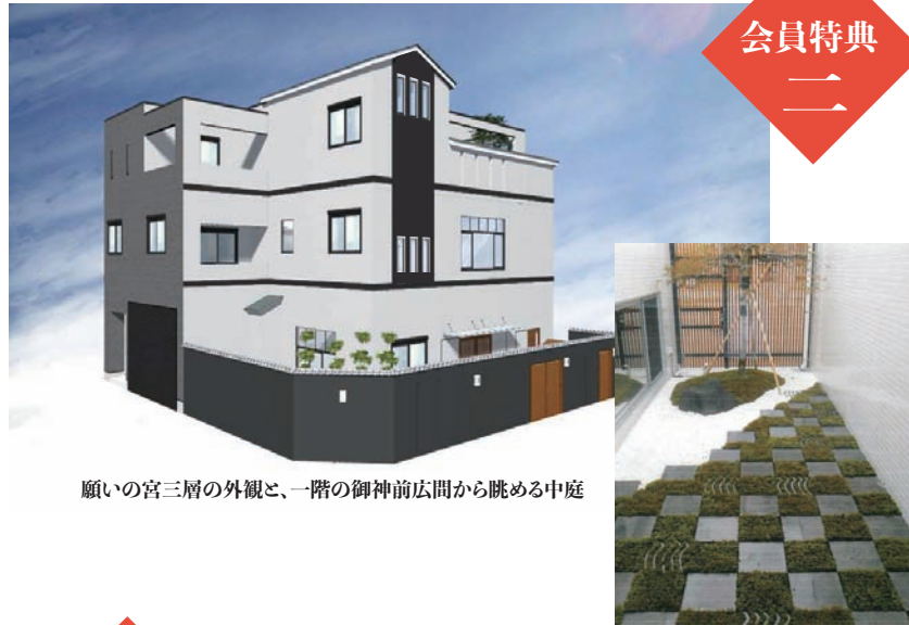
願いの宮三層の外観と、一階の御神前広間から眺める中庭

広間・大広間(舞台付き)をスペースレンタルいたし ます。お身内での集まりの他、イベント、セミナーの開 催などの商用利用もご相談ください。